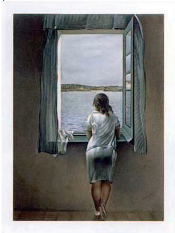
Devojka koja stoji na prozoru, Salvador Dalí, 1925.

vao je da je on reinkarnacija svog brata, kao što su mu roditelji rekli. Imao je i mlađu sestru, Anu Mariju, sa kojom je imao veoma čudan odnos. Jednom prilikom namerno ju je šutnuo nogom u glavu dok je trčao na krov kuće da bi video kometu. Ona je predstavljena Merkurom, vladarem 3. kuće, koji na sebe prima konjunkciju Marsa u Biku. Mars se nalazi na fiksnoj zvezdi Algol, koja često daje nasilje i povrede glave i vrata. Iz ovoga se vidi doživljeni udarac posle koga ju je Dali, kako je izjavio, još više voleo. Ovako čudan odnos sa sestrom predstavljen je Venerom u 11. kući i u trigonu sa Uranom. Ana Marija je bila njegov jedini ženski model sve do pojave njegove buduće žene, Gale Eluard. Gala je preuzela ulogu modela, što ju je učinilo Ana Marijinom večnom neprijateljicom. Jedna od Dalijeve karakteristika bila je prikazivanje devojke okrenute leđima. Da je često slikao sestru vidi se kroz konjunkciju vladara 5. kuće, Marsa, sa Merkurom koji je vladar 3. kuće, a i signifikator za rodbinu. U ovom slučaju je to sestra jer u Merkur u živi Venera pošto se nalazi u znaku Bika. Merkur je u kvadratu sa Saturnom, koji je vladar 7. kuće, pa je time prikazano neprijateljstvo između Dalijeve sestre i žene. Vladar 5. kuće u konjunkciji sa Merkurom u Biku, koji je retrogradan i vladar je 12. kuće, opisuje devojke koje su okrenute leđima na slikama.