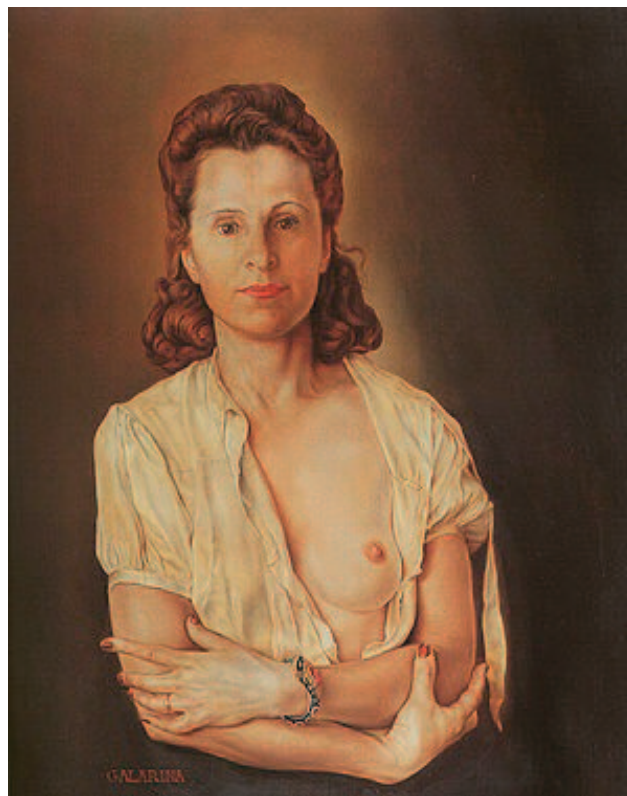
Galarina, Salvador Dali, 1944.

vano pričama o njegovom mazohizmu, fobijama i autoerotizmu. Bila je starija od njega, što i predstavlja 7. kuća u znaku Jarca. Kad su se upoznali, ona je bila udata, što opisuje egzaktni kvadrat između Saturna, vladara 7. kuće, i Sunca, koje predstavlja njenog muža, koji je bio pesnik (konjunkcija sa retrogradnim Merkurom, vladarem 12. kuće, znak Bika). Kvadrat Saturna sa Merkurom govori i da je ona ostavila dete. Ona ostavlja porodicu da bi bila sa Dalijem, pa je prikazana Saturnom u Vodoliji, tj. kao razvedena, što je takođe i simbolika Venere u 11. kući i u trigonu sa Uranom, a i Meseca u kvadratu sa Uranom. Jedna od prvih Dalijevih impresija u vezi sa njom je da ima veoma inteligentno lice, o čemu i govori znak Vodolije i Uran. Dalijeve emocije prema njoj su u početku bile toliko jake da je jedva uspevao da govori s njom od histeričnog smeha. Smeh je u simbolici Venere koja se ovde nalazi u 11. kući i trigonu sa Uranom, koji donosi histeriju. Gala je bila muza i drugim umetnicima pre Dalija. Stvarali su najbolja dela dok su bili sa njom i komentarisali među sobom: „A, da... ovo je sigurno nastalo dok si bio sa Galom.“ Ona je predstavljena i Venerom u znaku Bika u 11. kući, u trigonu sa Uranom, pa je njihov odnos bio slobodan i neobičan.